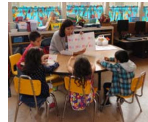
Aumentando las Habilidades de Aprendizaje